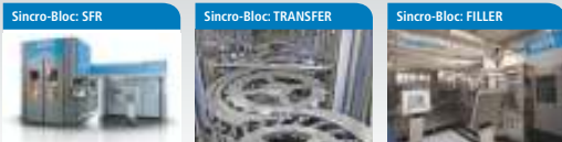
Sincro-Bloc: SFR Blocco sincronizzato tra soffiatore e riempitrice. È l'innovativa soluzione integrata per la produzione riempimento-tappatura per bottiglie in PET che garantisce una serie di vantaggi in termini di efficienza produttiva, pulizia dei contenitori e riduzione degli ingredienti. La flessibilità operativa di questa soluzione consente la combinazione di tutti i modelli di soffiatore con l'intera gamma di riempitrici, a seconda del prodotto finale da trattare. Sincro-Bloc: TRANSFER Sincro-Bloc: FILLER