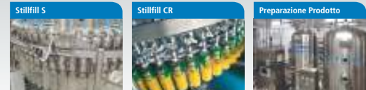
Stillfill S Riempricce meccanica a gravità progettata per il riempimento di acqua piatte e prodotti non gassati a freddo. Stillfill CR Riempricce meccanica a gravità con iccicola, progettata per il riempimento a caldo di succhi di frutta, tè e prodotti isotonic. Preparazione Prodotto ACQUA MIX: saturatori per acqua. DIPLOMIX: miscelatori. MASSELDIP: miscelatori automatici a controllo massico.