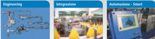
Engineering Progettiamo impianti ragionando sul concetto "prodotti line" come unica unità produttiva e non come semplice insieme di singole applicazioni. Integrazione Dedichiamo grande attenzione alla quantità e alla qualità dei nostri servizi: le varie macchine e alla scelta dei migliori elementi da integrare. Automazione - Smart Fondamentale è partire sui migliori componenti per l'automazione e la logica di funzionamento della linea, insieme a quelli per il controllo e la supervisione.