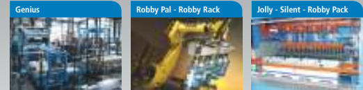
Genius Sistemi completi di palettizzazione/depalettizzazione tradizionali con alimentazione dall'alto e dal basso. Robby Pal - Robby Rack Soluzioni robotizzate di movimentazione di qualsiasi genere di cartoni, personalizzate secondo le esigenze specifiche del cliente. Jolly - Silent - Robby Pack Famiglia di incarnonatrici e incarnotatrici sia tradizionali che robotizzate per soddisfare le più diverse esigenze produttive.