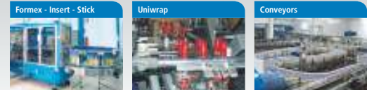
Formex - Insert - Stick Linee complete di incartamento per la preparazione e chiusura di cartoni, anche con insettore di alveari. Uniwrap Incarnonatrici con sistema wraparound a movimento continuo. Dispositivo brevettato di inserimento alveari a richiesta. Conveyors Sistemi di trasporto a elementi modulari studiati per realizzare impianti di movimentazione di qualsiasi contenitore.