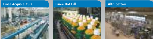
Linee Acqua e CSD Linee complete che rappresentano il core business aziendale, in particolare quelle per bottiglie in PET. Linee Hot Fill Grande importanza anche per la fornitura di linee per succhi (con e senza polpa), tè freddo e prodotti isotonici. Altri Settori Siamo in grado di offrire linee complete anche per vino e alcool, birra, latte e derivati, oli, food e prodotti chimici.